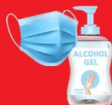
แจกแมส, เจล